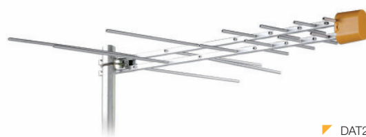
▶ DAT2 (1030)